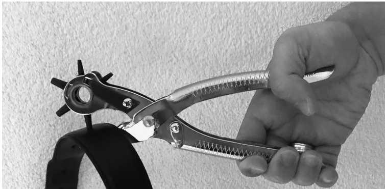
Bilal gebruikt de gatentang

Bilal gebruikt een gatentang om een extra gat in zijn riem te maken. De tang heeft snijbuisjes met verschillende diameters.